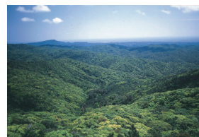
やんばるの濃く深い緑 (本島北部)