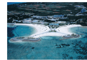
人工ビーチ (海洋博記念公園、本部町)