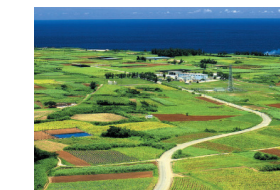
たばこ畑がつくる 緑の風景 (伊江村)