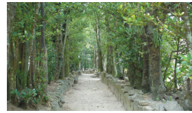
フクギ並木道 (本部町備瀬地区)