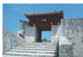
素材としての石灰岩 (首里城、那覇市)