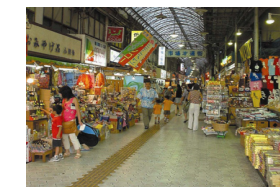
市場の風景(那覇市)