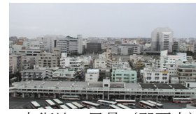
市街地の風景 (那覇市)