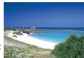
白い砂浜と青い海