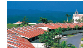
カヌチャベイ (名護市)