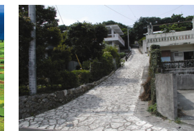
石畳が復元された集落 (中城村新垣)