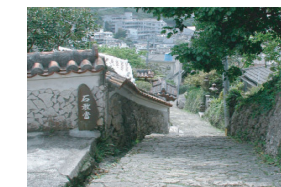
首里金城地区の石畳 (那覇市)